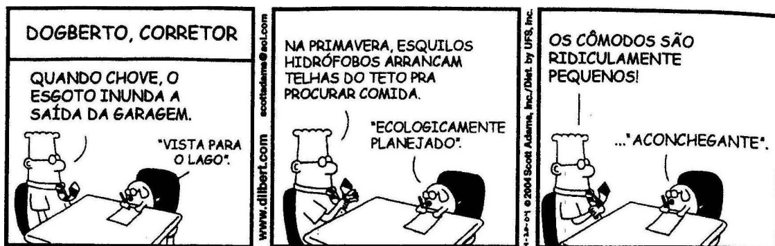
(Scott Adams. Dilbert. Zero Hora, Informe Econômico, 2004.)

Texto para responder às questões 01 e 02.